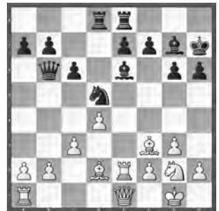
Gähwiler – Gallagher

Versetzen Sie sich in die weisse Lage. Rechnen Sie aktive Ideen durch!