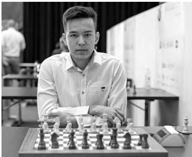
Nodirbek Abdusattorov: malchance à Bienne, champion olympique à Chennai (voir p. 12).

36. ... ♖c6! Un coup important, car le fou g2 allait se retrouver vulnérable. 36. ... ♖xb8 37. ♗xb8+ ♕h7 38. ♗h2 ♗xc3 était seulement égal.