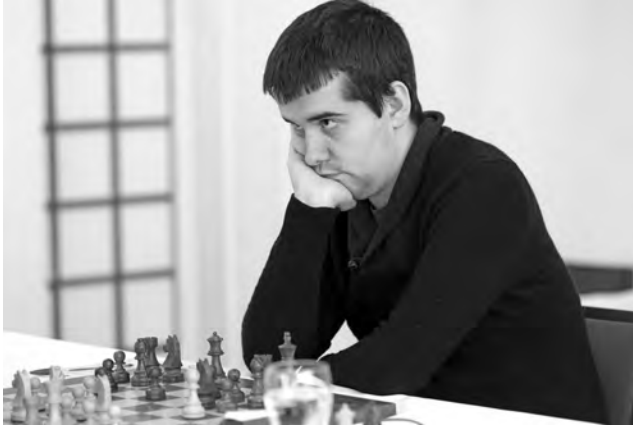
Ian Nepomniachtchi gagne le tournoi des Candidats pour la deuxième fois consécutive.

et ... ♖h6 à venir, tandis que 23. ♙e4? perd sur-le-champ à cause de 23. ... ♜xe4! 24. ♜xe4 ♚g6! 25. ♘d2 ♘f6 26. f3 ♚xg3+ et la position blanche s'écroule. 22. ♚d2? 22. ♜ad1 pour sacrifier en d5 au prochain coup maintenait un certain équilibre. 22. ... ♜ae8 23. ♙h2. Maintenant 23. ♜xd5 n'a plus de sens car après 23. ... cxd5 24. ♚xd5 le pion e2 est en prise: 24. ... ♚xe2 25. ♚xf5 ♚xc4. 23. ... ♙g4 24. ♘a5