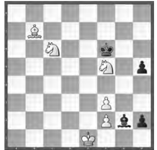
Weiss zieht und gewinnt