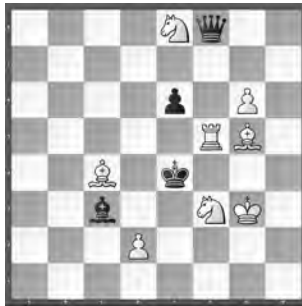
15301 Udo Degener und Werner Schmoll Postdam (D) und Traun (A)