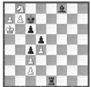
Weiss zieht und hält remis

Lösungen mit Kommentaren bis 31. Oktober per E-Mail an roland.ott@swisschess.ch