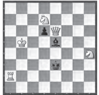
15320 Petrašin Petrašinović Belgrad (SRB)