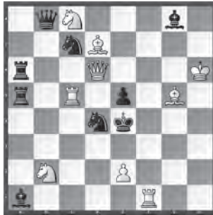
15319 Herbert Ahues Publikation post mortem

15312 St. Felber. 1. ♔b4? (2. ♔c4, 2. ♔b5+ ♔d5 3. ♚c3+ ♔d6 4. ♜c5+ ♔c7 5. ♔b5+, ♔d5+) ♚e5! – 1. ♔b5! (2. ♜c5+ ♔xc7 3. ♔a6) ♔f1+ 2. ♔b4! ♚d2+ 3. ♔b3 (4. ♜e6) ♚h3 4. ♔c4 (5. ♔b5) ♚f1+ 5. ♔d4 (6. ♜e6) ♚c3+ 6. ♔xc3 (7. ♜e6) ♚h3, ♚c4 7. ♔d4 (8. ♔b5 Zzw.) ♚f1 8. ♜e6. Lepuschütz-Thema. – «Unbeirrt durch s Schachgebote stellt der w ♔ ständig neue Drohungen auf!» (JB)