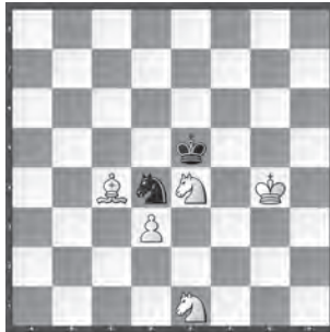
15323 Anatolij Stepotschkin Tula (RUS)