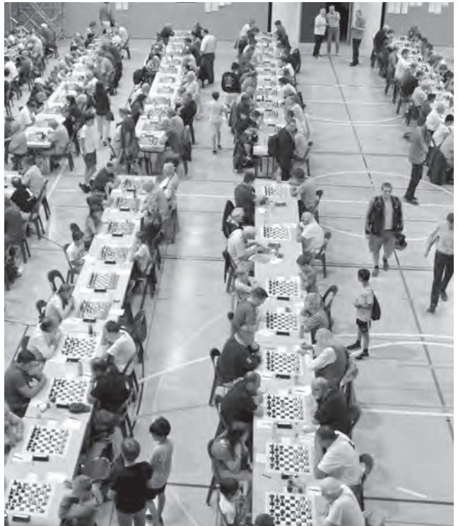
La FSE veut mieux commercialiser les grands tournois nationaux comme les Championnats suisses individuels (sur la photo, le CSI 2019 à Loèche-les-Bains).