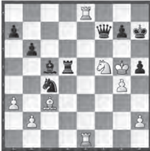
Zuferi – Peng

Wie bringt Schwarz den weissen König hier rasch zur Strecke?