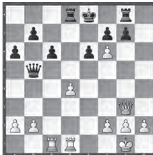
Hollan – Demuth

Schwarzer König in der Mitte. Nutzen Sie das mit Weiss aus!