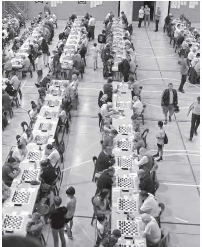
Der SSB will grosse nationale Turniere wie die Schweizer Einzelmeisterschaften (im Bild die SEM 2019 in Leukerbad) besser vermarkten.