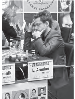
Levon Aronian, sportif d'élite

19. ♜xe5 ♜xe5 20. ♜xe5 ♜xb3 21. ♜xd8 ♜xd8 22. axb3 ♜d1+ 23. ♜f1. Au début, lorsqu'Aronian a joué 18. ... e5, nous avons tous cru qu'il y allait y avoir ici à un moment ou à un autre ♜d2 et que les Noirs auraient toute la compensation du monde. Or, Kramnik a rapidement pris et il apparaît qu'il n'y a rien du tout! Le coup ♜f8 est un aveu cinglant. 23. ... ♜f8 24. b4 ♜c6 25. ♜e2. Voilà comment on fait nulle. Kramnik, le joueur le plus précis au monde, celui qui a une technique d'orfèvre, rate 25. ... ♜e4 a5 26. bxa5 bxa5 (26. ... ♜xa5 27. ♜b4) 27. g3 ♜b1 28. ♜e2