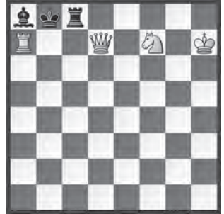
2 Charles Pelle Weinheimer-Gedenkturnier «Orakel» 1947, Spezialpreis für Miniaturen