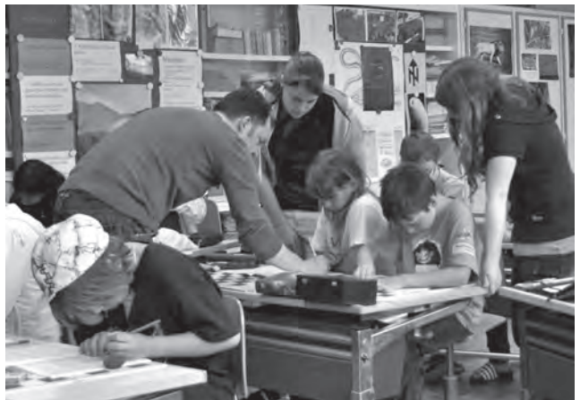
Die intensive Auseinandersetzung mit dem Schachspiel über eine längere Zeitdauer führt zu stärkeren Leistungen von Schülern im Bereich des logischen und räumlichen Denkens.