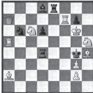
3 Henk Prins Belgisch Schackbord 1986 2. Preis