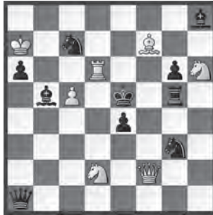
14851 Herbert Ahues Bremen (D)

14844 H. Baumann 1. Le4 Lc6! 2. Lg6? Ld5 3. ? 1. h4!? Lc6? 2. Le6+; 1. ... Ld7! 2. Lg6 Le6 3. Le4 Lc4! 4. Lc6? Lb5! – 1. Ld3! Lb5 2. Lg6! Lc4 3. Le4 Le4 4. Lc6 (5. La4) Ld7 5. Ld5 (2. ... Le8 3. Lh5 2. ... fxc6 3. f7 – 4. f8D 5. Db4). Paradox: Ein Peri-Antikritikus führt zum erwünschten Kritikus (Autor). Abdrängung als Schnittpunkthema?? Kritik bzgl. Richtpunkt? «Hitziges L-Duell!» (WL).