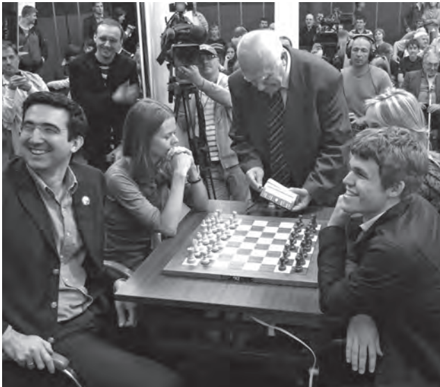
Kramnik et Carlsen se fendent la poire

Dans l'idéal, consacrer 40 minutes aux 20 premiers coups puis 80 aux 20 suivants paraîtrait