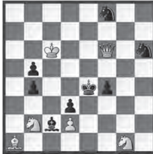
14875 Herbert Ahues Bremen (D)

14868 R. Krätzscher. 1. Sb5? (2. Txb6/Sc7) Lf6/Tg4 matt! - 1. Sa6! (2. T~7/Sc7) Txa6 2. Txe7+ Kb8 3. Tb7+ Ka8 4. Sb5 Tg4 5. Kxg4 Ta4+ 6. Kg5 Tg4+ 7. Kxg4 exf5 8. Kxf5 Se7+ 9. Txe7+ Kb8 10. Te8 6. ... Lf6+ 7. Kxf6 8. Txd7+ Kb8 9. Tb7+ Ka8 10. Sc7/Txb6. Berlinthema in 2 parallelen Abspielen (Autor). «Sehr schöner Vorplan und Hauptplan. Schwarz hat ziemlich viel Munition, schliesslich aber sein Pulver doch verschossen» (AOe).