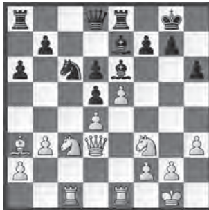
Vladimir Baklan (Ukr) – Hou Yifan (Chi)

18. ... ♙c8 19. exd6 ♙xd6 20. ♙xd6 ♙xd6 21. ♖e5 ♖e7 22. ♙d2 ♖f5 23. ♖e2 ♙xc1 24. ♙xc1 ♖f5 25. ♖f3 ♙f7 26. ♙e1 h5 27. ♖c3 ♙c8 28. ♖a4 b5 29. ♙d3 ♙f4. Sur toute cette phase,