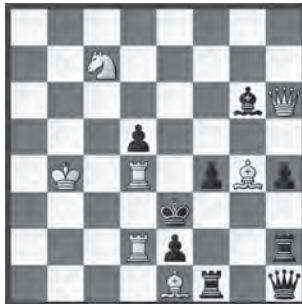
3 Roland Löwe Schach 1967, 1. Preis