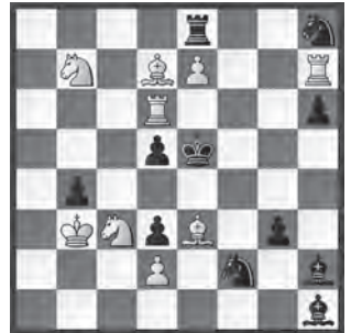
14878 Arieh Grinblat Ashdod (Isr)