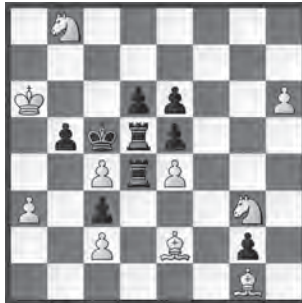
14877 Markus Wettstein Umina Beach (Aus)