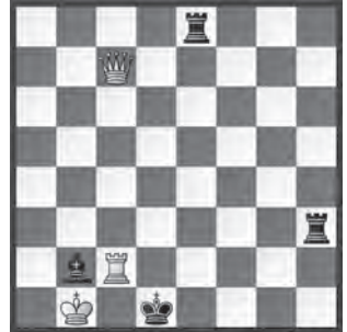
2 Otto Würzburg Gazette Times 1916