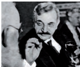
Zelebrierte das Spiel gegen den Mann: Emanuel Lasker.

Die meisten Menschen lernen das schon im Kindergarten. Wir Schachspieler sind da etwas schwerer von Begriff. Erst sehr spät gelangen wir (wenn überhaupt) zur Erkenntnis, dass es viel mehr Spass macht, gegen den Mann statt gegen die Figuren zu spielen.