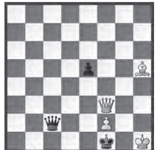
14880 Baldur Kozdon Flensburg (D)