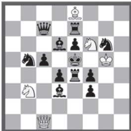
Matt in vier Zügen

Wo eine Stellung ist, da kann auch die Lösung gefunden werden. Mit Klaus Köchli und Computer gelingt sowohl Rekonstruktion als auch Lösung. Man darf gespannt sein: ein Matt in vier!