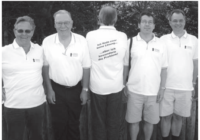
Die SEM wird immer wieder zum Catwalk origineller T-Shirts mit Schachmotiven. Diese fünf Mitglieder des Schachklubs Roche Basel verblüfften ihre Gegner mit dem aufgedruckten Spruch auf dem Rücken: «Ich finde zwar keine Lösung...aber ich bewundere das Problem!»