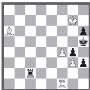
14633 Wilfried Seehofer Hamburg (D)