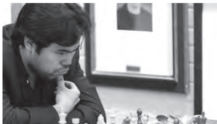
Der amerikanische Top-10-Spieler Hikaru Nakamura wird sowohl im Grossmeister-Turnier als auch im Blitz-Spektakel zu sehen sein.

► Facebook: Biel International Chess Festival