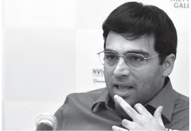
Viswanathan Anand reste champion du monde.

1. d4 d5 2. c4 c6 3. ♖c3 ♖f6 4. e3 e6 5. ♖f3 ♖bd7 6. ♖c2 ♙d6 7. ♙d3 0-0 8. 0-0 e5 9. cxd5 cxd5 10. e4 exd4 11. ♖xd5 ♖xd5 12. exd5 h6 13. b3. Nouveauté. 13. ♖xd4 ♖h4 14. ♖f3 ♖h5 15. ♙h7+ ♙h8 16. ♖f5 avait déjà été joué par Karpov et Kramnik en 1996! Le 14 ème champion du monde avait joué 16. ... g5, alors que le coup «moderne»