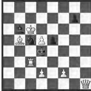
14905 Josef Kupper Zürich

14898 O. Schmitt. 1. Sxg4+? Ke4? 2. Sf6+ Ke5 3. Lxf3 usw.; 1. ... Kd5! 2. Sf6+ Kc6 – 1. Tc3! (2. Tc5+ dxc5 3. Lc7) dxc3 2. La5 (3. Lxc3) Kd4 3. Se6+ Ke5 4. Sd8! Kd4 5. Lb6+ Ke5 6. Sxg4+ K~ 7. Sf6+ Ke5 8. La5! (8. Lxf3? Sf2! 9. Sf7+ Ke6 10. Ld5+ Ke7) Kd4 9. Se6+ Ke5 10. Sf8! Kd4 11. Lb6+ Ke5 und nun 12. Lxf3 (13. Sg4) d5 13. Lc5 Sf2 14. Sg6+ Ke6 15. Lxd5. «Nice sacrifice followed by two switchbacks in the foreground in order to avoid the escape of the BK in c6» (Autor). «Schwierige Aufgabe!» (PN).