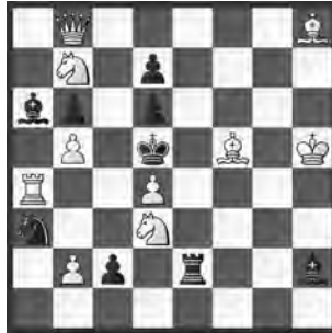
1 Herbert Ahues Lenin-120 JT 1990 1. Preis

6) 1. g5! (2. Sf3+ Lxf3 3. Ld4+) d1D, T 2. Sd3+ D,Txd3 3. Lf4+ 1. ... Lxg6 2. Sxg6+ Ke4 3. Td4+ 1. ... Sg4,f5+ 2. T(x)f5+ Ke4 3. Td4+ 1. ... Sxf7 2. Sg4+ Lxg4 3. Td5+.