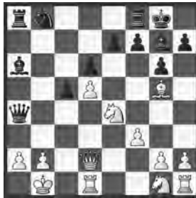
Stefanow – Andrejew Bulgarien, 1957

Schwarz am Zug kündigte ein Matt in zehn Zügen an!