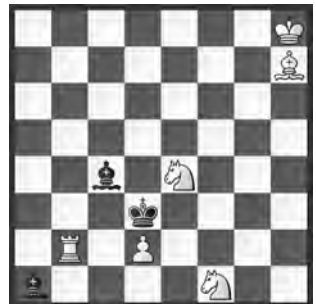
4 Ronald Turnbull The Problemist 1990