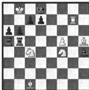
5 Visvaldis Veders Die Schwalbe 1994 3. ehrende Erwähnung