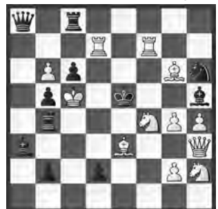
6 Camillo Gamnitzer The Problemist 1988 2. ehrende Erwähnung