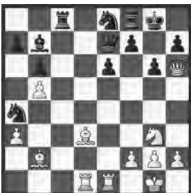
Spielmann – Hönlinger Wien, 1929

Weiss am Zug. Die Schwächen am schwarzen Königsflügel sind offensichtlich. Doch die Gewinnabwicklung muss genau berechnet werden!