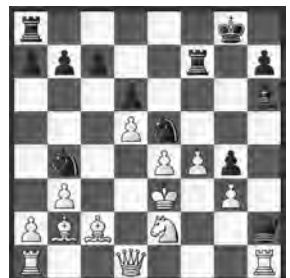
Polugajewski – Nezhmetdinow Sotchi, 1958

Schwarz am Zug. Wie nutzte Schwarz die weisse Königsposition aus?