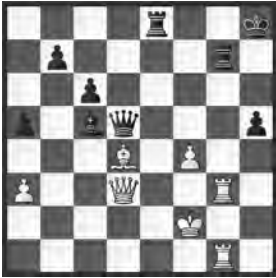
Misto – Kloza Polen, 1955

Weiss am Zug. Wie rückt der Anziehende dem schwarzen König zu Leibe?