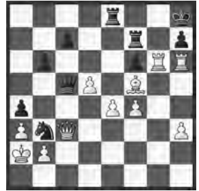
Aljechin – Yates Semmering, 1926

Weiss am Zug. Noch eine schwingulose Angriffskombination Aljechins.