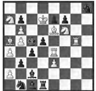
14908 Cor Sammelius Korrektur Markus Wettstein Sydney (Aus)