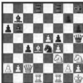
Torrez – Aljechin Sevilla, 1922

Schwarz am Zug. Da stimmt einiges nicht innerhalb der weissen Position. Wie nutzte Aljechin seine Vorteile aus?