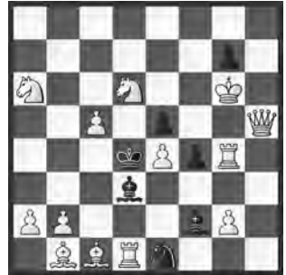
2 Marcel Tribowski Berlin-München 1988 1. Platz