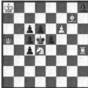
14909 Petrašin Petrašinovič Belgrad (SRB)