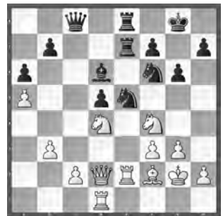
Hakimifard – Stojanovic 2. Runde: Réti – Solothurn

Was hatte Weiss bei ihrem letzten Zug 27. ♖e1–e2 übersehen?