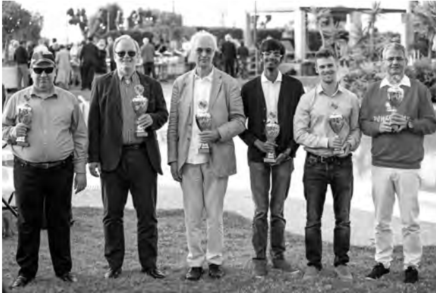
Die sechs ACO-Weltmeister von Rhodos.

Das Rahmenprogramm umfasste Grossmeister-Simultane, Ausflüge auf die Insel, mehrere Seminare mit Grossmeistern sowie drei Blitzturniere mit jeweils mehr als 120 Teilnehmern. Informationen über die ACO-Amateurweltmeisterschaft 2020 finden Sie unter www.amateurchess.com . Falko Bindrich