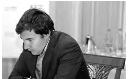
Sergey Karjakin est parvenu à concrétiser une finale à matériel très réduit par une étonnante facilité!

Toute cette variante, où les Noirs ont sacrifié une pièce, semble avoir été beaucoup analysée à très haut niveau. La «petite amélioration» des Blancs n'est inter-