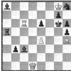
3 Anton Trilling Die Schwalbe 1939