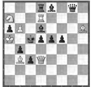
15190 Grigorij Atajanz Rostovskaja Obl. (Rus)