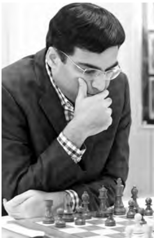
Viswanathan Anand a laissé s'échapper un demi-point.

41. ♖e7?? ♜d1+! Et les Noirs vont donner un échec perpétuel par ... ♜d4+ puis ... ♜a1+ ou ... ♜g1+. 1/2-1/2.