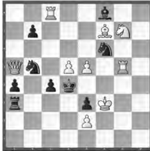
15187 Herbert Ahues Publikation post mortem

15180 O. Mihalčo. 1. d4! h2 2. ♖hx2 ♖d2 3. ♖f3+ ♖c1 4. ♖a3! (Tempo) b4+ 5. ♖b3! bxc3 6. ♖c2 f5 7. ♖xc3 f6 (besser als f4) 8. ♖e1 f4 9. ♖d3. – «Raffiniertes Tempomanöver des w♖ klemmt den generischen ♖ entscheidend ein» (RO).