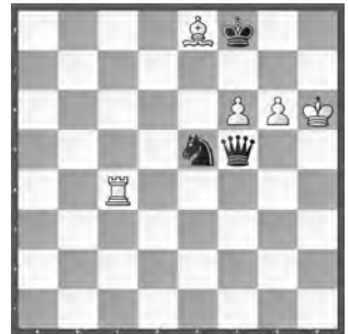
Weiss zieht und hält remis