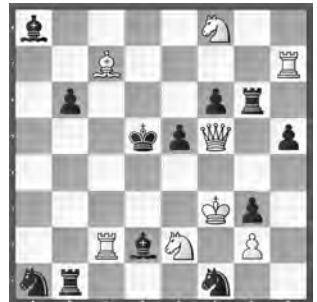
6 Leonid Makaronez Moskau-Turnier 1982 1. Preis