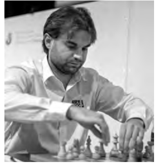
Magnifique partie de Sam Shankland.

9. ... ♙e7. Une variante rare. Les Noirs préfèrent souvent jouer 9. ... b5 (la variante Kozul).