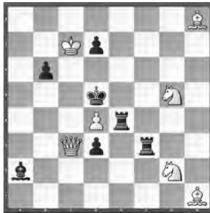
15193 Herbert Ahues Publikation post mortem

15186 R. Krätschmer. 1. ♔e2? (2. ♔f5+ ♔h5 3. f4) ♔a1 matt! – 1. ♔e7! (2. ♔xg5) ♔xe7+ 2. ♔a4! (2. ♔a2? dauert länger) ♔g5 3. ♔e2 ♔a1+ 4. ♔b5 ♔e1! 5. ♔f5+ ♔h5 6. f4+ ♔xe2 7. ♔xg5; 2. ... f5 3. ♔xf5+ ♔h5 4. ♔xh3 ♔a1+ 5. ♔b5 ♔g1 6. ♔g4+ ♔xg4 7. fxg4. – «Ein vortreffliches, schnörkelloses Musterproblem zur Illustration der Themen Berlin und Lepuschütz» (KIK). «Diese Verknüpfung von Lepuschütz und Berlin-Thema mit 2 Varianten funktioniert toll» (RO). «Streng logischer Mehrzüger, 2-gleisig ab 2. s Zug!» (JB).