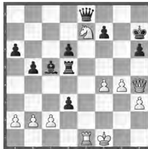
Georgiadis – Kurmann Herren-Titelturnier

Mit welchem überraschenden Zug kommt Schwarz zu sehr starkem Gegenspiel?