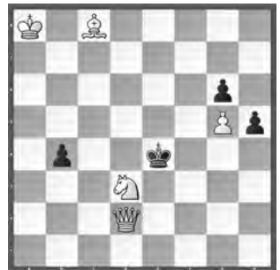
15198 Petrašin Petrašiniović Belgrad (SB)