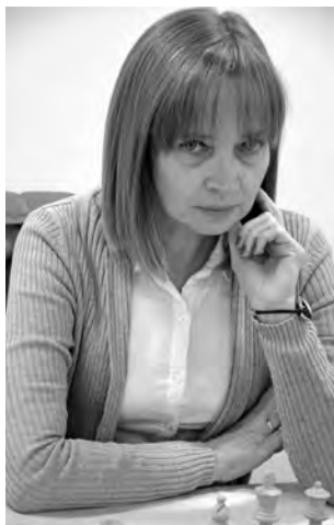
Campionessa svizzera: Elena Sedina

Elena Sedina, classe 1968, laurea in economia politica presso l'Università di Kiev e dottorato di ricerca sui metodi di allenamento per gli scacchi presso l'Istituto di cultura fisica della stessa città, dopo essere stata Campionessa femminile assoluta della Città di Kiev a 11 anni, campionessa dell'Unione Sovietica U18 a 16 anni e campionessa femminile dell'Ucraina a 19 anni, nonché medaglia d'oro di scacchiera alle Olimpiadi di Mosca, è diventata Gran Maestra Femminile nel 1996 e Maestro Internazionale (lo stesso titolo conseguito dagli uomini!) nel 1998. Nell'aprile del 2003, accreditata di 2434 punti ELO,