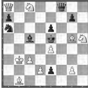
1 Juri Marker Neue Zürcher Zeitung 2001 1. ehrende Erwähnung

4) Beginnt mit einer Fluchtfeld-Freigabe: 1. ♔b1! (2. ♔e3+ ♔e6 3. ♜e8) e4! 2. ♜xh3+ A! ♜xh3/♔xh3 3. ♔d4 B/♔g7 1. ... ♔e4! 2. ♔d4+ B! ♜xd4/exd4 3. ♜xh3 A/♔g7 (1. ... ♔e6 2. ♔g7+ ♔e7 3. ♜e8; 1. ... ♔f3 2. ♜xf3+ ♜xf3/♔e6 3. ♔d4/♜e8). Ah! So kann man das ja auch erreichen. Der Komponist erwähnte selber mit keinem Wort das Keller-Paradox... Man kann ja auch leicht daneben greifen.