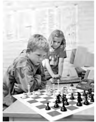
«Magnus – Der Mozart des Schachs» dokumentiert die Kindheit des amtierenden Weltmeisters.

Indirekt mit dem legendären Weltmeister zu tun hat «Searching for Bobby Fischer» (1993), der an amerikanischen Schulen einen Schachboom ausgelöst hat. Der Film beschreibt die Reise des amerikanischen Wunderkinds Joshua Waitzkin durch die Schachwelt. Der heute 44-jährige Waitzkin galt einst als grösstes Schachtalent der USA seit Bobby Fischer. Er brachte es immerhin zum Titel eines Internationalen Meisters, beendete dann aber seine Schachkarriere und wurde Taijiquan-Kampfsportler.