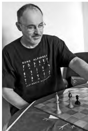
Jaroslav Polášek.