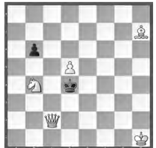
15252 Petrašin Petrašinović Belgrad (Srb)