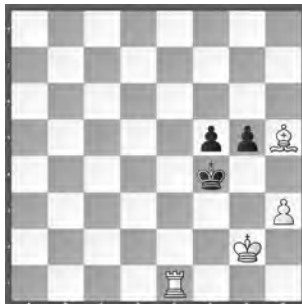
15251 Anatolij Kamratov Uljanowsk (Rus)