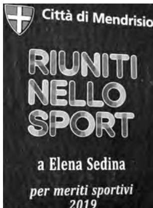
La targa di merito del Comune di Mendrisio.

Il Covid ha pure mandato all'aria l'evento «Riuniti nello sport» organizzato dal Dicastero Sport e Tempo libero del Comune di Mendrisio che si sarebbe dovuto tenere a inizio 2020 per festeggiare i meriti degli sportivi locali messi particolarmente in luce