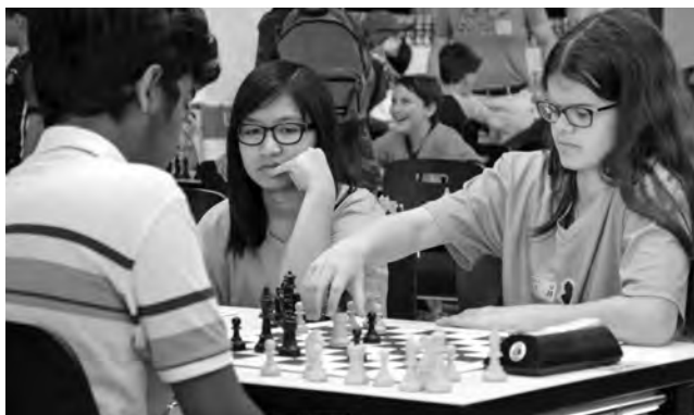
Selon Christine Zoppas, les filles apprécient les compétitions en équipes et de pouvoir y montrer leur potentiel.

Vous avez évoqué la finale des filles, lancée il y a deux ans. Dans quelle mesure est-il impor-