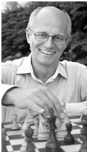
SSB-Zentralpräsident Peter A. Wyss: «Wir unternehmen alles, um trotz der schwierigen Planung möglichst viele Verbandsturniere über die Bühne zu bringen.»

Die Team-Cup-Achttelfinals wurden vom 21. März auf den 18. April verschoben. Die weiteren Runden finden am 2. Mai (Viertelfinals), 9. Mai (Halbfinals) und 13. Juni (Final) statt.