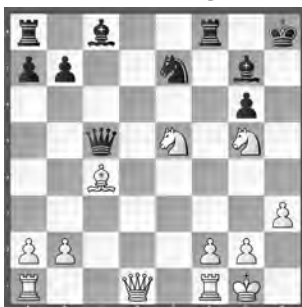
Dahl – A. Wenger

Wie setzt Weiss am Zug in drei Zügen matt?